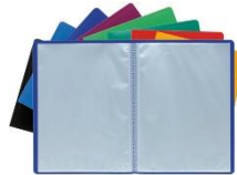
2 portes-vues de 100 vues