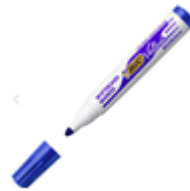
un feutre d'ardoise