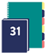
un agenda ou cahier de texte