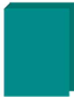
un grand classeur CP CE1 CE2 uniquement