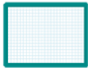
une ardoise blanche