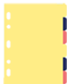
6 intercalaires cartonnés