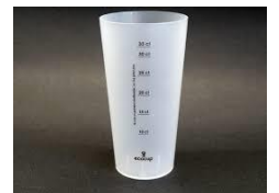
1 gobelet réutilisable au nom de l'enfant

Une réserve : dans une boîte à chaussure qui sera conservée dans la classe au prénom de l'enfant il peut y avoir : 10 crayons de papier HB, 5 stylos bleus, 4 gommes, 10 bâtons de colle, 10 feutres d'ardoise.