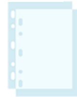
50 pochettes transparentes