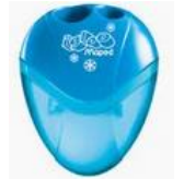
un taille-crayon avec réservoir