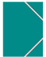
2 pochettes à rabats