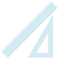
une règle 20cm et une équerre