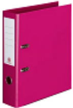
1 gros classeur Gros anneaux