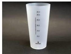
1 gobelet réutilisable au nom de l'enfant