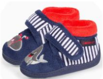
Une paire De chausson TPS PS