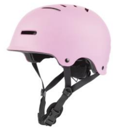
Un casque à vélo Au nom de votre enfant