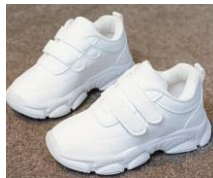
Une paire de basket blanche A scratch MS GS